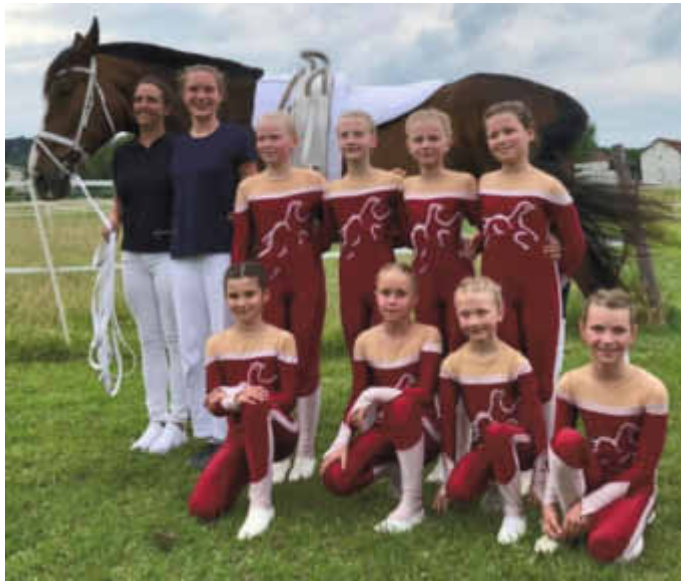
Siegreich mit dem Greif auf dem Trikot: Team Greifenstein Einsteiger mit ihrem Pferd Imbir