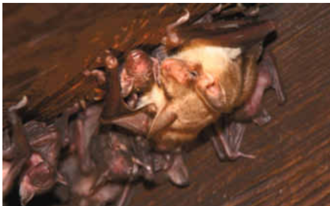
Ein Großes Mausohr umsorgt sein wenige Tage altes Jungtier. Im Hintergrund weitere Jungtiere deren Mütter bereits zur Insektenjagd ausgeflogen sind

Ende Mai bzw. Anfang Juni kommen bei den meisten Fledermäusen die Jungen zur Welt. Das gilt auch für die Großen Mausohren im Fledermaushaus der Hessischen Gesellschaft für Ornithologie und Naturschutz (HGON). Auf dem Dachboden des alten Fachwerkhauses in Greifenstein-Allendorf herrscht deswegen jetzt reger Trubel.