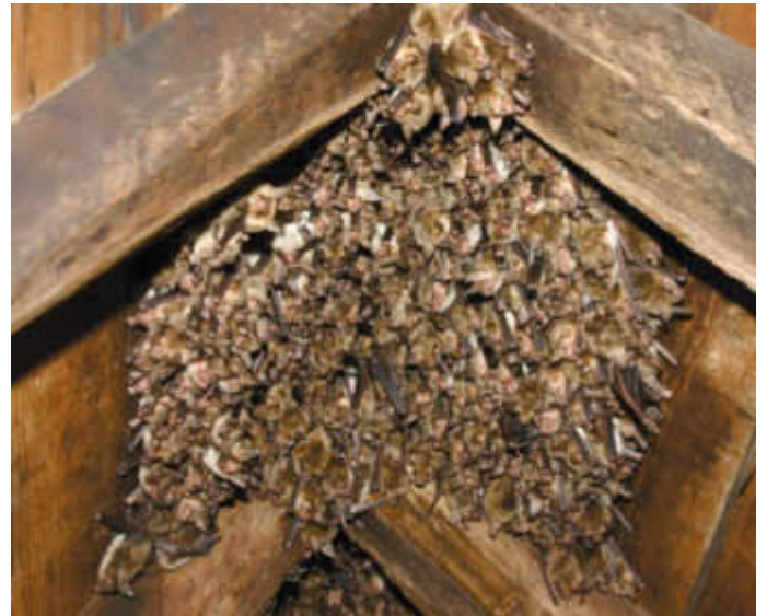
Blick auf den Dachboden: Dicht gedrängt hängen die Mausohrfledermäuse unter dem Gibel

Das Haus in der Ulmer Str. 16 gehört seit 2004 der HGON. Der Naturschutzverband betreibt dort ein Informationszentrum für den Fledermausschutz.