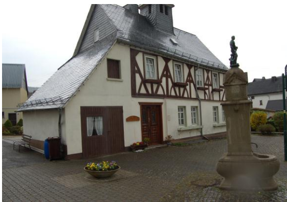
Die Ortsmitte, mit Blick auf das Dorfmuseum (ehemals Alte Schule) und das Ehrenmal.