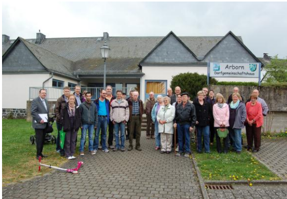
Der Ortsrundgang mit den Teilnehmerinnen und Teilnehmer startet auf dem Vorplatz des Dorfgemeinschaftshauses.

Lokale Veranstaltung Arborn am 11.04.2014 Zusammenfassung der Ergebnisse