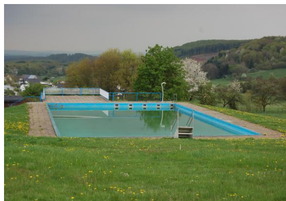
Das noch gut genutzte Freibad am Ortsrand von Arborn.