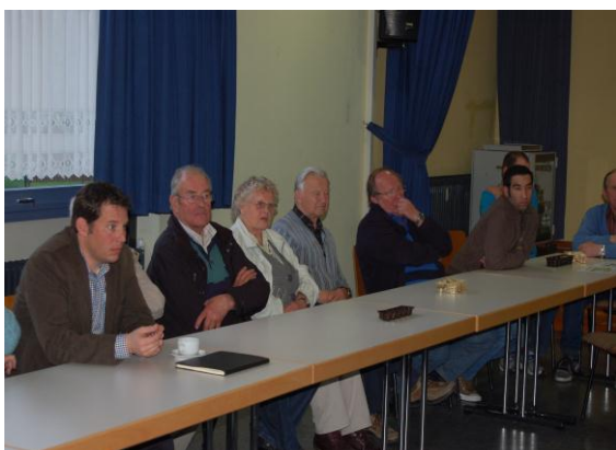
Die Ergebnisse des Rundganges wurden im Rahmen des anschließenden Workshops im DGH diskutiert.