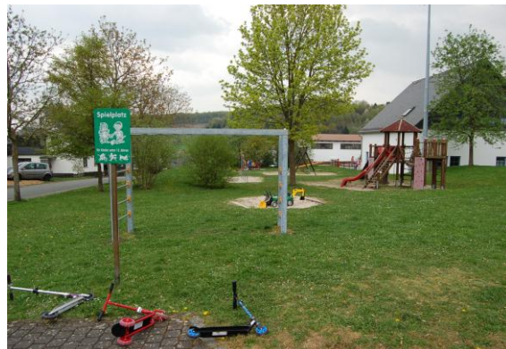
Blick auf den Kinderspielplatz. Er befindet sich angrenzend am DGH und Feuerwehrgerätehaus.