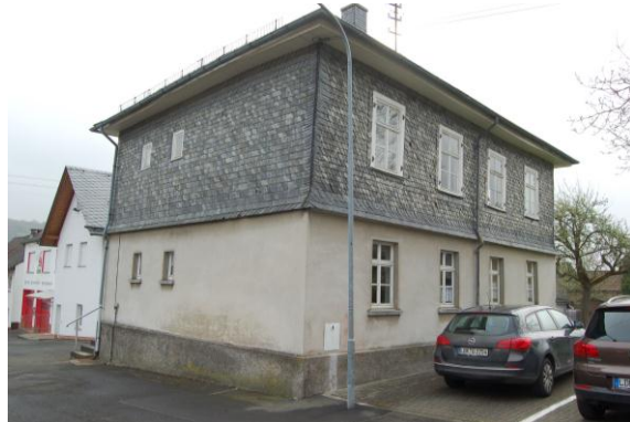
Blick auf das Vereinshaus in Holzhausen.