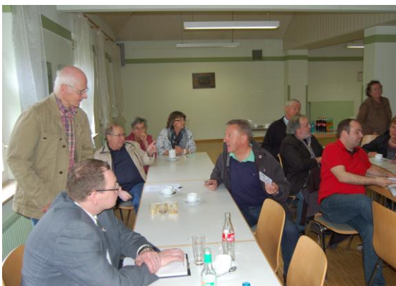
Die Ergebnisse des Rundganges wurden im Rahmen des anschließenden Workshops im DGH diskutiert.