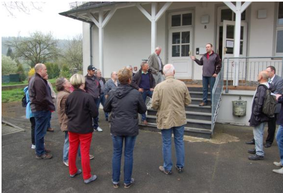
Die Teilnehmerinnen und Teilnehmer des Ortsrundganges diskutieren die Nutzungen des DGH und des Umfeldes.

Lokale Veranstaltung Holzhausen am 05.04.2014 Zusammenfassung der Ergebnisse