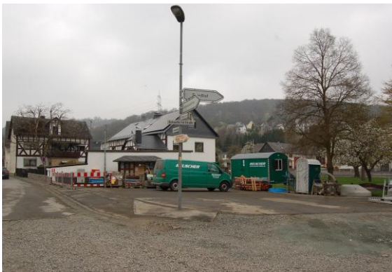
Der Platz „Kreuzgass“ wird saniert. Laut der Bevölkerung, ist er das Herzstück des Dorfes.