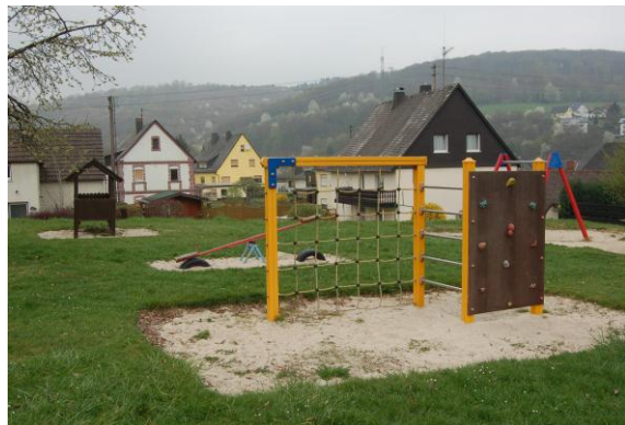
Blick auf einen der zwei Kinderspielplätze von Holzhausen. Er befindet sich hinter dem DGH.