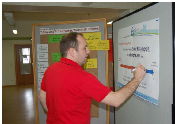
In einer Momentaufnahme schätzen die Teilnehmerinnen und Teilnehmer die Zukunftsfähigkeit von Holzhausens ein.