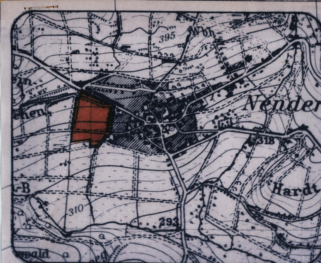
ÜBERSICHTSPLAN M 1:10 000